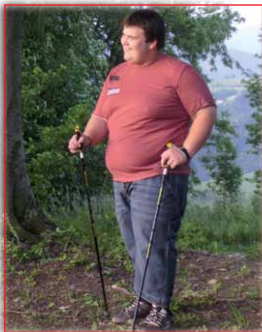
Therapiezentrum Buchenberg Waidhofen an der Ybbs